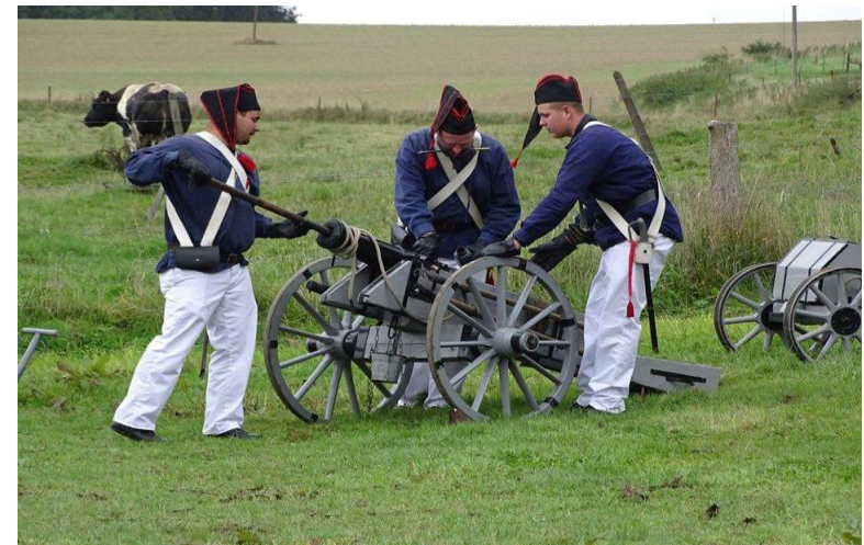
Artilleur au bataillon carré.

Les candidatures (et ou démissions) sont actées sur bases d'écrits. Le Président se réjouit de ces différentes candidatures. Elles sont autant de marques d'investissements et d'intérêts de la part des marcheurs.