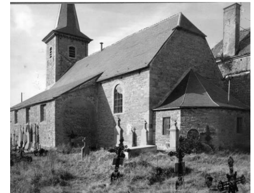
Furnaux, vers 1943